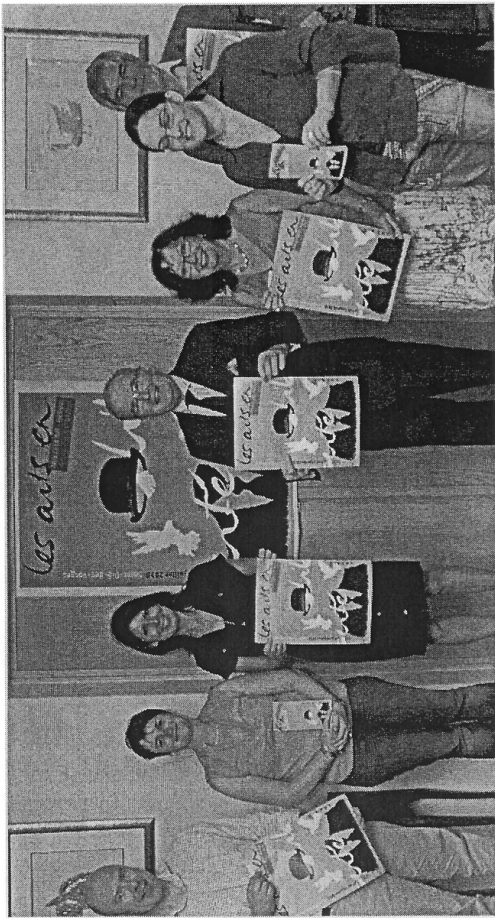
Le festival « Les Arts en liberté » s'affiche partout en Déodatie et ailleurs.

En début de soirée, ce sera l'heure de prendre l'apéro devant des groupes sélection-