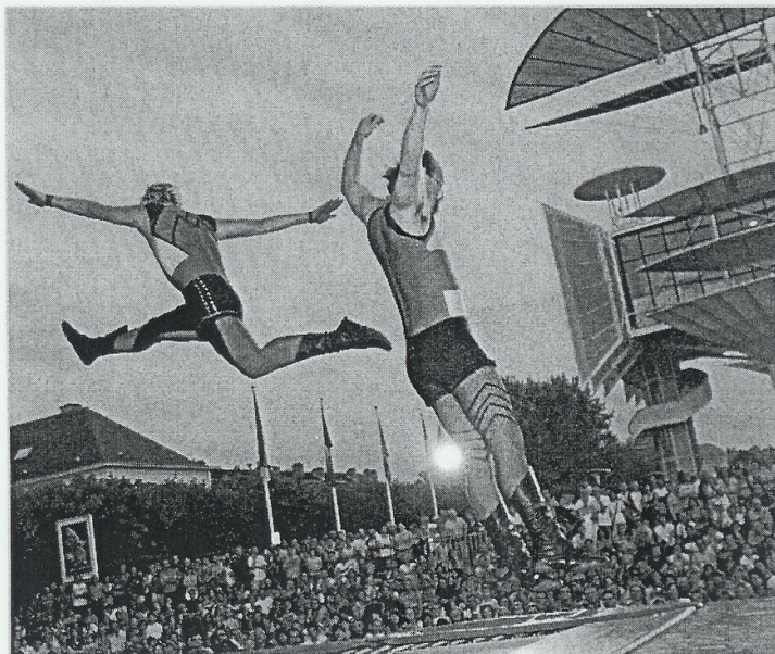
La complicité est indispensable pour les trois artistes de « Cirq'ulation locale » venus présenter hier soir un spectacle chorégraphique mêlant clownerie, jonglage et théâtre.

Au final, « Cirq'ulation locale » a montré ses nombreux atouts pour faire passer un bon moment et procurer à chacun du bien-être.