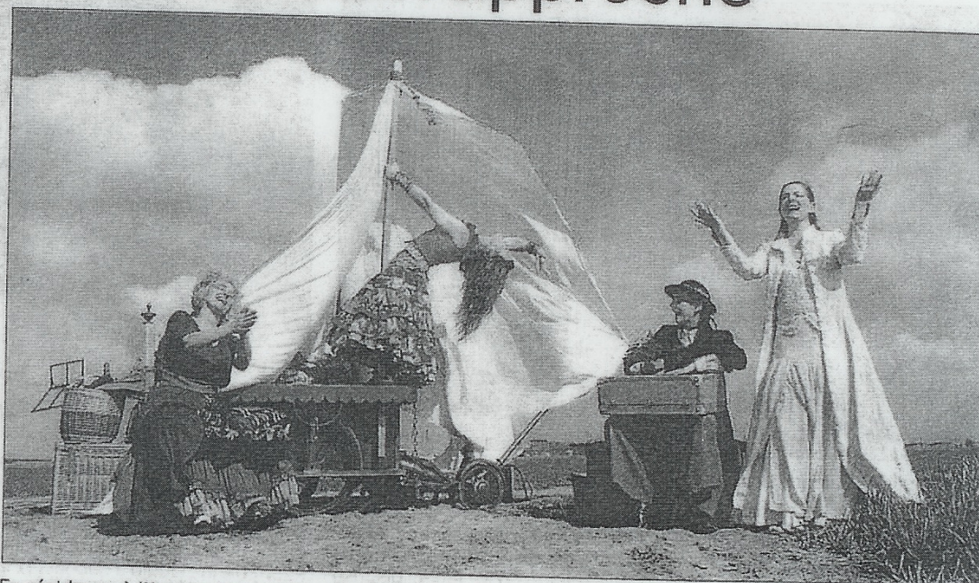
En résidence à l'Archipel en mai dernier, les X Filles promèneront leur spectacle vocal, Le Petit Véhicule, tout au long des quatre jours du festival.

Et de six ! D'année en année, le festival des arts de la rue granvillais ne cesse de s'émanciper. De 19 compagnies invitées lors de la première édition en 2003, elles seront plus de 40 cette année à proposer un total de 130 représentations.