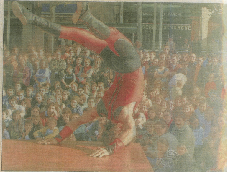
Jongleurs, acrobates, cascadeurs : la force rouge des Belges du trio Cir'ulation locale a fait un tabac samedi, place du marché.

Contents aussi, les organisateurs le sont car le festival revient annuel. Les pouvoirs publics ont fait un effort pour l'édition 2006. Sur un coût de 300.000 €, la Ville donne 105.000 €, la Région 60.000 €, le Département 7.500 € et les par-